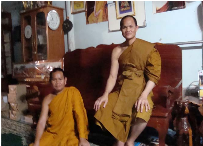
สัมภาษณ์ พระครูภาวนาโพธิคุณ,ดร. เจ้าคณะตำบลในเมือง เขต ๑ วัดโพธิ์โนนทัน วันที่ ๒๕ กุมภาพันธ์ ๒๕๕๓