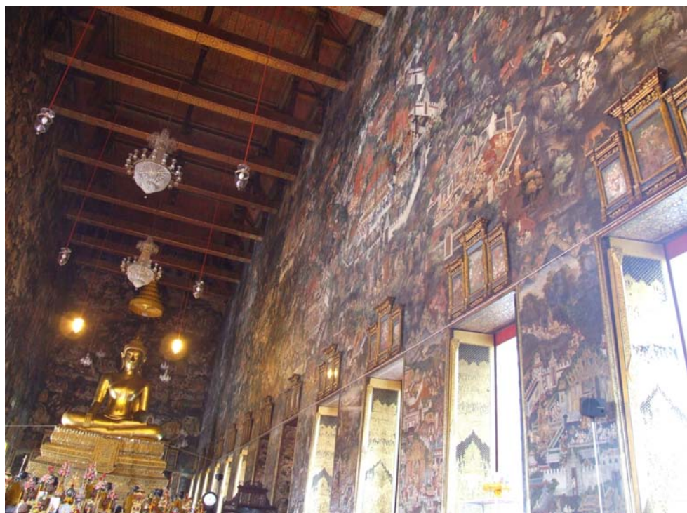
ภาพพระป้อนเจกพุทธเจ้า จากจิตรกรรมฝาผนังด้านขวา ในพระอุโบสถ และภาพจิตรกรรมประกอบบานหน้าต่าง วัดสุทัศนเทพวราราม ราชวรมหาวิหาร กรุงเทพมหานคร (ถ่ายเมื่อวันที่ ๒๕ ธันวาคม ๒๕๕๒)