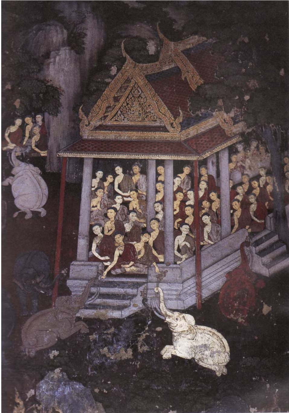
ภาพพระปัจเจกพุทธเจ้าทั้งหลาย เมื่อได้ตรัสรู้เป็นพระพุทธเจ้าแล้วก็จะพากันเหาะไปอยู่ ณ ภูเขาคันธมาถน์ มีเหล่าช้างสิบตระกูล คอยเฝ้าปรนนิบัติ *ภาพจากจิตรกรรมฝาผนังในพระอุโบสถวัดสุทัศนเทพวราราม ราชวรวิหาร

°ช้าง ๑๐ ตระกูล คือ ๑) ตระกูลช้างกาฬวากะ ๒) กังเคยยะ ๓) ปันฑระ ๔) ตัมพะ ๕) ปิงคละ ๖) กัณฐะ ๗) มังคละ ๘) เหมะ ๙) อุโปสถะ ๑๐) นัททันตะ (จุ.จ.อ.(บาลี) ๑/๕๖).