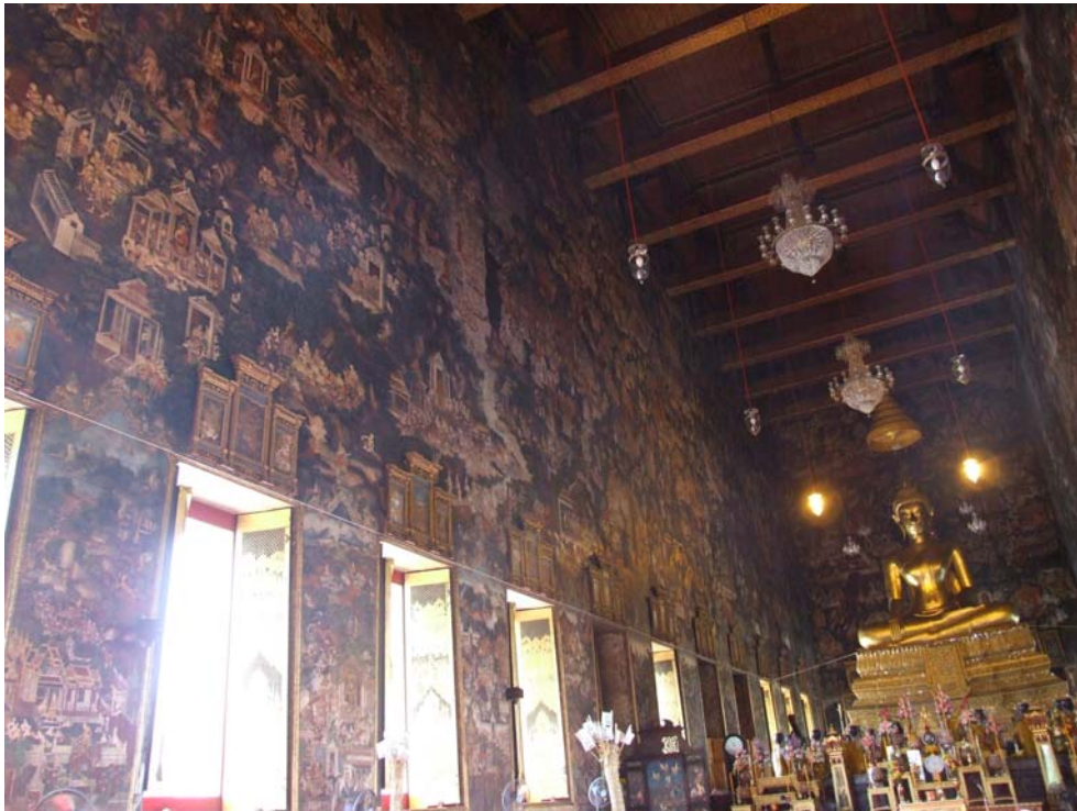
ภาพพระป้อนเจกพุทธเจ้า จากจิตรกรรมฝาผนังด้านซ้าย และภาพจิตรกรรมประกอบบานหน้าต่างพระอุโบสถ