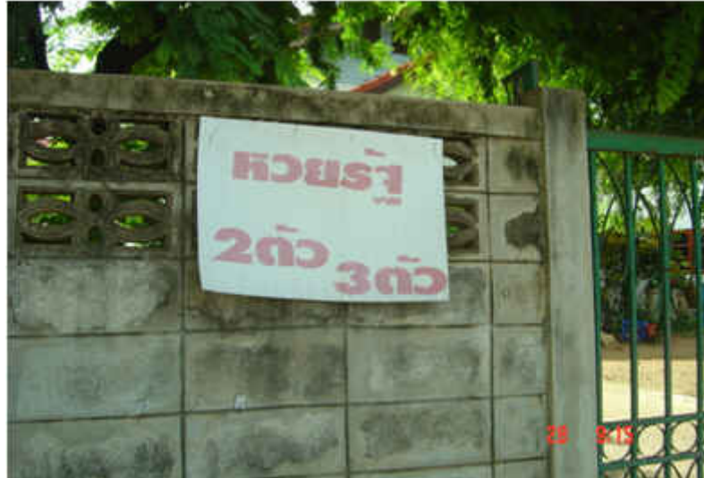
ภาพที่ ๔ บ้านที่จำหน่ายทวยรัฐบาล ประเภท เลขท้าย ๒ ตัว ๓ ตัว