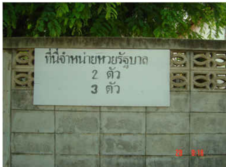
ภาพที่ ๓ และ ๔

เป็นภาพที่ชาวบ้านทั่วไปติดประกาศขายทวยของรัฐ ทั้ง ๒ ตัว และ ๓ ตัว อย่างเปิดเผย เพื่อให้ผู้ที่ชอบเล่นการพนันทวยได้ทราบและซื้อ-ขายได้อย่างสะดวกสบาย