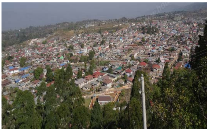
แผนภาพที่ ๔.๑ เมืองหลวงของรัฐฉาน เมืองตองจี

กล่าวได้ว่า ชาวไทใหญ่มีประวัติศาสตร์ความเป็นมายาวนานนับ ๑,๐๐๐ ปี ทำให้ชาวไทใหญ่ค่อนข้างมีเอกลักษณ์เฉพาะตัวที่โดดเด่น แต่ภาวะสงครามดุร้ายทำให้ไม่สามารถมีสถานภาพที่โดดเด่นปรากฏต่อสายตาชาวโลก โดยเฉพาะในช่วงหลังจากที่ประเทศอังกฤษให้อิสรภาพกับเมียนมาร์ ชาวไทใหญ่ยังอยู่ภายใต้การครอบงำของระบบทหาร ถึงแม้จะมีรูปแบบที่ไม่เปิดโอกาสให้ชาวไทใหญ่สามารถแสดงถึงอัตลักษณ์ของตนเองได้มากนัก แต่กลับเป็นแรงผลักดันให้ชาวไทใหญ่เกิดการรวมกันด้วยความเข้มแข็ง