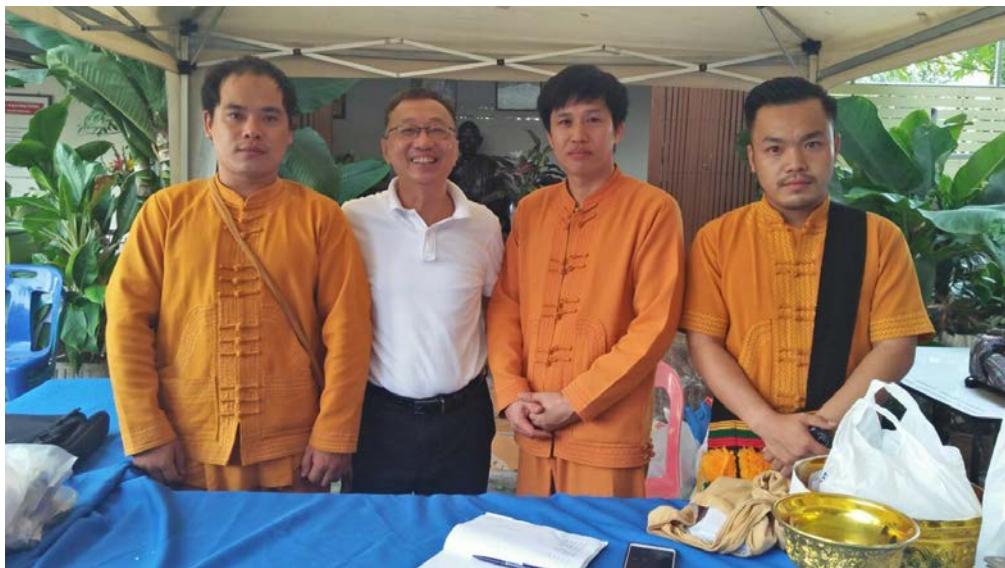
ภาพที่ ๘ การเข้าพิธีกรรมการทำบุญของชาวไตใหญ่