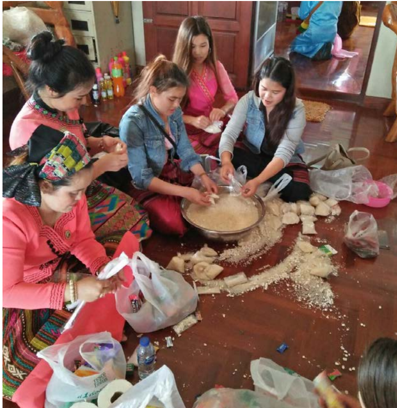
ภาพที่ ๑๐ เตรียมงานก่อนวันทำบุญชาวไทใหญ่ที่ศูนย์