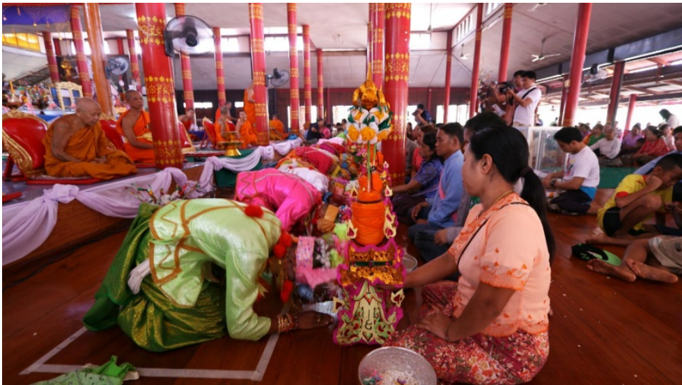
ภาพที่ ๒ แสดงถึงประเพณีการบวช เป็นการสืบทอดวัฒนธรรมและประเพณี