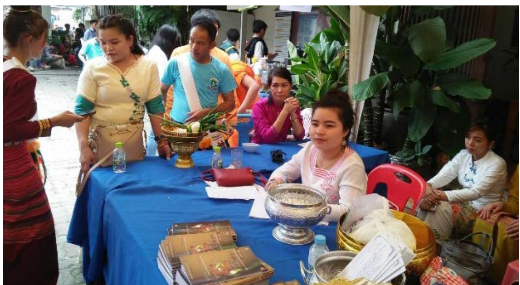
ภาพที่ ๖ แสดงถึงวัฒนธรรมการแต่งกายและการจัดพิธีต้อนรับแขกผู้มาเยือน