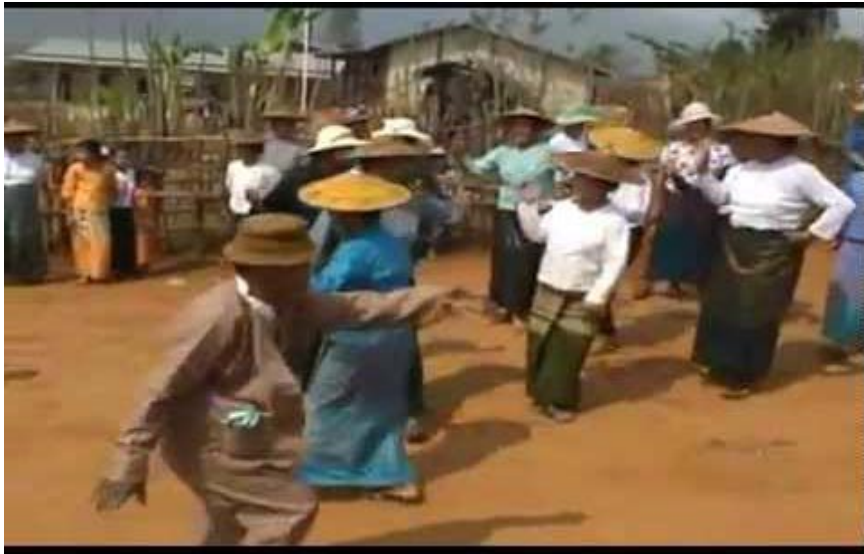
ภาพที่ ๗ การแสดงเต้นรำของชาวไต