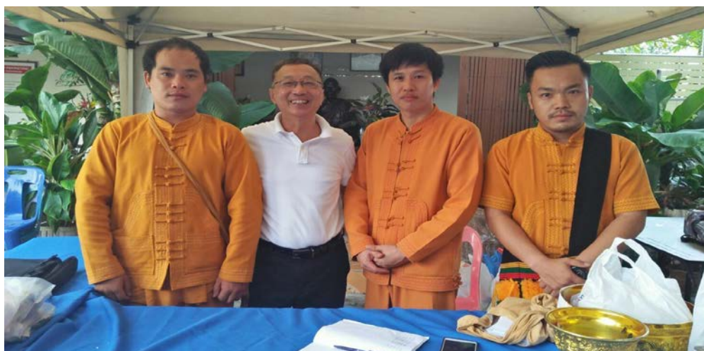
ภาพที่ ๔.๘ เข้าพิธีกรรมการทำบุญของชาวไตใหญ่

การเปลี่ยนแปลงอย่างสร้างสรรค์ของชาวไตในรัฐฉาน มีการเปลี่ยนแปลงอย่างค่อยเป็นค่อยไปตามสภาพภูมิประเทศเป็นภูเขาลูกเล็กเรียงรายสลับกันเป็นลูก ๆ ไป เรียกว่าดอย ซึ่งดอยแต่ละลูกก็มีสิ่งปลูกสร้างที่เป็นบ้านน่าจะเรียกว่ากระท่อมมากกว่า เพราะปลูกกันแบบง่าย ๆ โดยใช้สิ่งของไม้ที่อย่างก็สามารถปลูกบ้านได้แล้วนั่นคือบ้านหนึ่งหลังจะมีเสาอยู่สี่ต้นบ้างหกต้นบ้าง แล้วแต่จะพออยู่สำหรับสมาชิกในครอบครัวหลังคามุงด้วยหญ้าคาสังกะสีหรือกระเบื้องคงเป็นไปได้ยากเพียงแค่นี้หลังคาบังแดดบังฝนเท่านั้นก็ดีโขแล้วละ ส่วนฝาและกระดานปูพื้นอาศัยไม้ไผ่ที่มีอยู่ทั่วไปบนดอย เป็นฝาบ้านและใช้ปูพื้นด้วยเหินไหมหละว่าคำว่าบ้าน ณ ที่แห่งนี้ใช้วัสดุไม้ก็อย่างเอง ก็สามารถทำเป็นบ้านอันอบอุ่นได้ ไฉนเล่าเราคนเมืองกรุงจึงไม่ค่อยจะรู้จักคำว่าพอยู่พอกินเหมือนเขาบ้าง