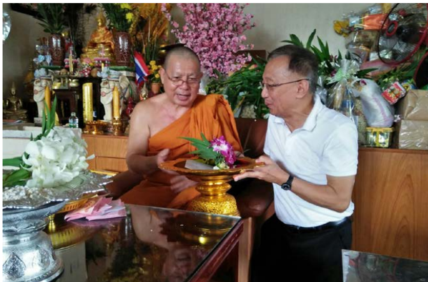
ภาพที่ ๑๑ ร่วมทำบุญถวายปัจจัยเตรียมงานทำบุญชาวไทใหญ่ที่ศูนย์