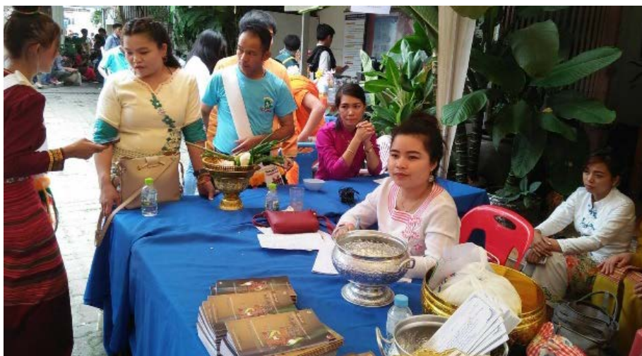
ภาพที่ ๔.๖ วัฒนธรรมการแต่งกายและการจัดพิธีต้อนรับแขกผู้มาเยือน

วิถีชีวิตของชาวไทใหญ่ ปัจจุบัน ก็จะมีสภาพชีวิตและความเป็นอยู่ต่าง ๆ ของชาวไทใหญ่เป็นสภาพชีวิตของคนต่างถิ่นที่อพยพเคลื่อนย้าย เข้ามาอยู่ปะปนกับชาวไทยพื้นเมืองอาศัยอยู่ร่วมกันได้อย่างสันติ ดำรงชีวิตด้วยการค้าขายและการรับจ้าง ขยายแรงงาน มีการผสมผสานวิถีชีวิต ประเพณีและพิธีกรรมต่าง ๆ ที่เกี่ยวข้องกับครอบครัวให้เข้ากับชาวพื้นเมือง ประเพณีการเกิดการแต่งงาน วิถีชีวิตเริ่มเปลี่ยนแปลงตามยุคหรือความเจริญเข้าเกี่ยวข้อง จึงทำให้วัฒนธรรมดั้งเดิมของชาวไทใหญ่ เริ่มรับรู้และนำวัฒนธรรมต่างถิ่นเข้าสู่ชุมชน โดยการถ่ายทอดผ่านเยาวชนรุ่นใหม่ หรือถ่ายทอดจากด้านเทคโนโลยี จึงเกิดวัฒนธรรมแบบผสมผสานจากวัฒนธรรมดั้งเดิมเป็นวัฒนธรรมร่วมสมัย ผู้วิจัยได้ถอดบทเรียนวิถีวัฒนธรรมของชาวไทใหญ่ในกรอบของสันติวัฒนธรรมเชิงพุทธ ดังนี้