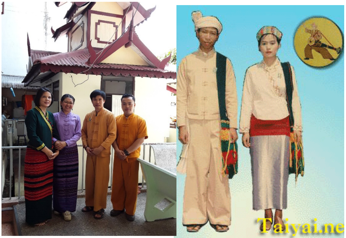
ภาพที่ ๕ แสดงถึงวัฒนธรรมการแต่งกายชาวไตใหญ่