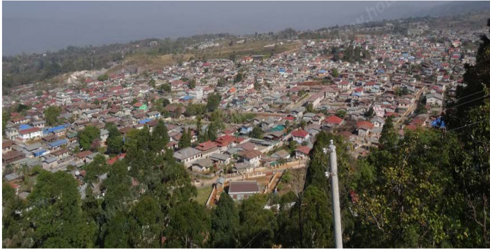
ภาพที่ ๑ แสดงถึงเมืองหลวงของรัฐฉาน เมืองตองจี