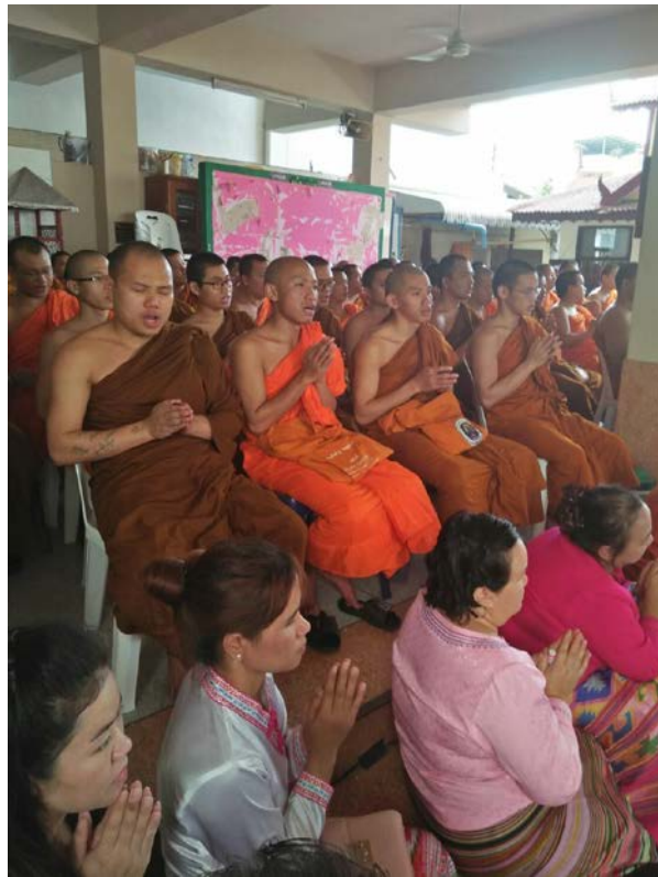
ภาพที่ ๘ การทำบุญของชาวไทใหญ่ที่ศูนย์