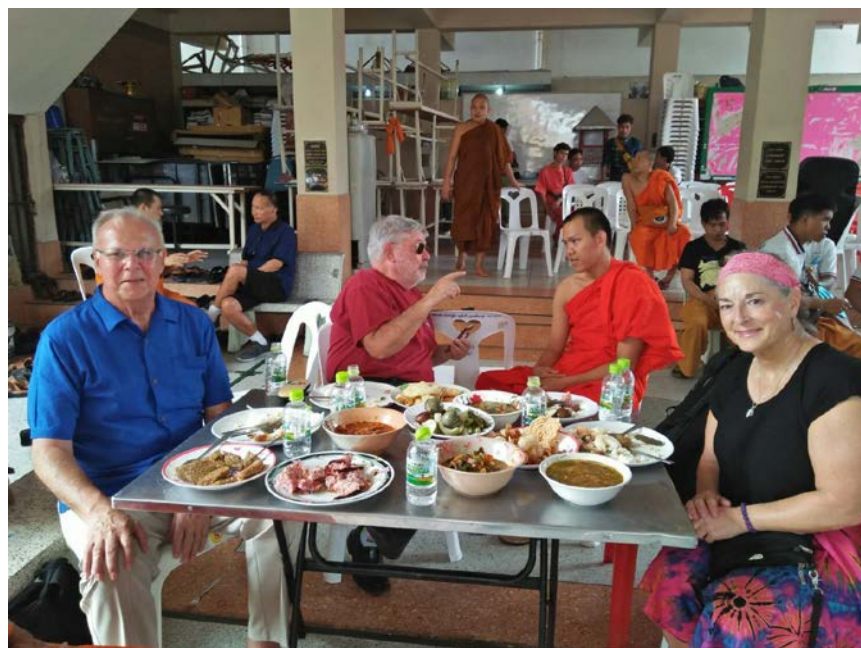
ภาพที่ ๙ ชาวต่างชาติเข้าพิธีการทำบุญชาวไทใหญ่ที่ศูนย์