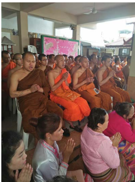
ภาพที่ ๔.๘ การทำบุญของชาวไทใหญ่ที่ศูนย์

ประเทศเพื่อนบ้านที่ต้องให้การคุ้มครองดูแลอีกต่อไป ประเด็นสำคัญในทุกวันนี้จึงอยู่ที่ว่ารัฐบาลพม่า นั้นมีความจริงใจที่จะให้โอกาสแก่บรรดาผู้นำและปัญญาชนชาวไทใหญ่ (รัฐฉาน) เพียงใด ในการที่จะให้ พวกเขามีส่วนร่วมในการบริหารและพัฒนา รัฐฉาน วันนี้รัฐฉานก็ยังทำการต่อสู้เพื่อทวงคืนสัญญาที่จะได้ ปกครองตนเองจากรัฐบาลพม่าอยู่